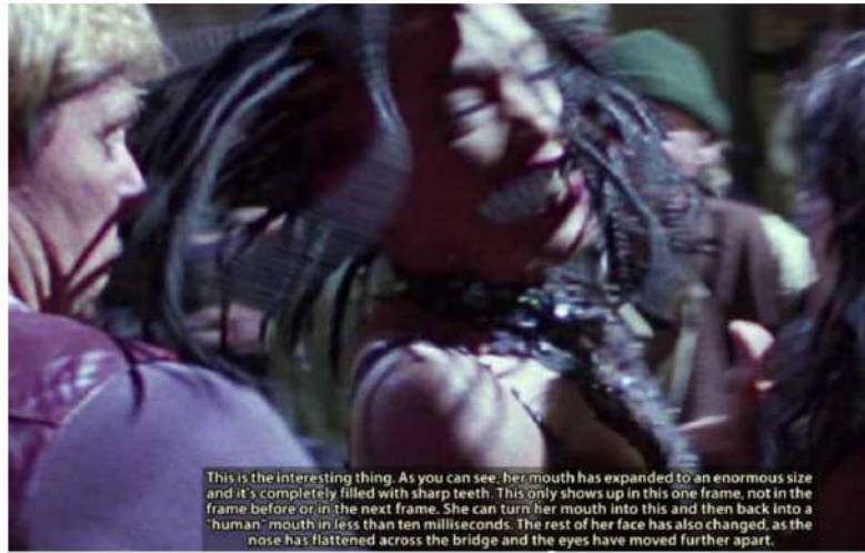
تغییر چهره - دهان غیر عادی و دندان درندگان ( دندان رپتیلی )