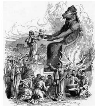
پیشکش کودکان به مولوخ (sacrifice ritual)