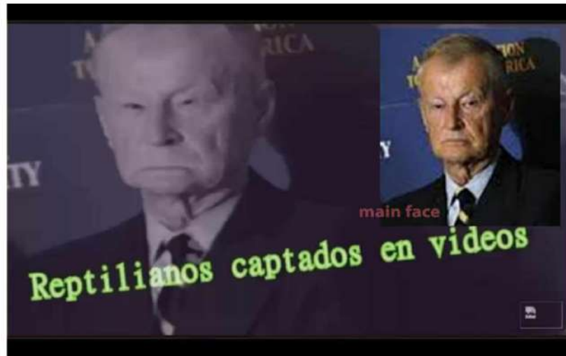
تغییر ساختار صورت