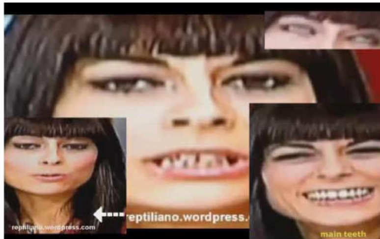
خانم گزارشگر تصویر بالا