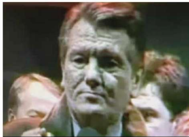
پوست فلس دار

* حال تصاویر زیر را ببینید : تصاویری که همه به وسیله زیرک ترین و متخصص ترین ها تهیه شده اند ( این تصاویر همه از کلیپ های ویدئویی استخراج شده اند و جای ذره ای شبهه باقی نگذارده اند . ) مواظب باشید ضعف های فکری که به ما تزریق کرده اند و یا وسوسه شیاطینی که تقریبا همه جا هستند ، ما را از دیدن واقعیت با این درجه وضوح پرت نکنند و شیاطین درنده با چشم بندی ، خود و نقشه های وحشیانه شان را مخفی نگه ندارند .