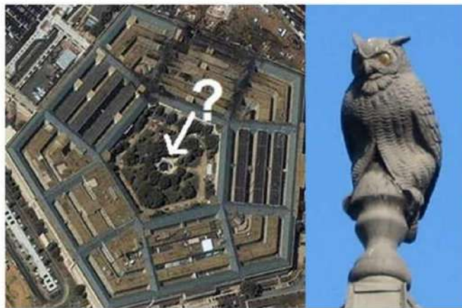
OWL LOCATED IN THE CENTER OF THE PENTAGON

جغد نمادی دیگر برای مولوخ در مرکز پنتاگون