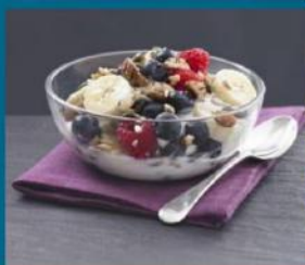
صبحانه ای پر انرژی