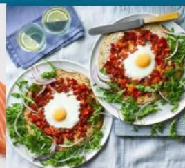
ناهار سریع و سالم