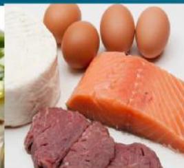
بهترین منابع پروتئین